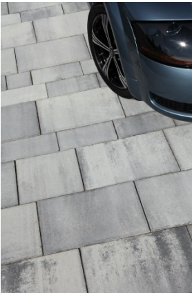
Bildtext: Innovationspreis für Rund-um-Frost-Tausalzbeständigkeit von Pflastersteinen, www.steine.at